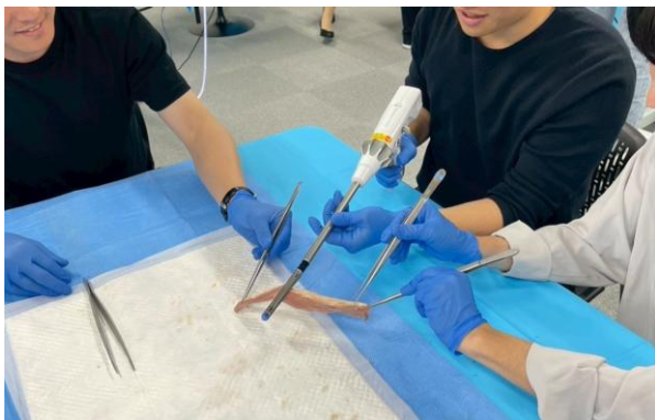
消化管手縫い・器械吻合トレーニング