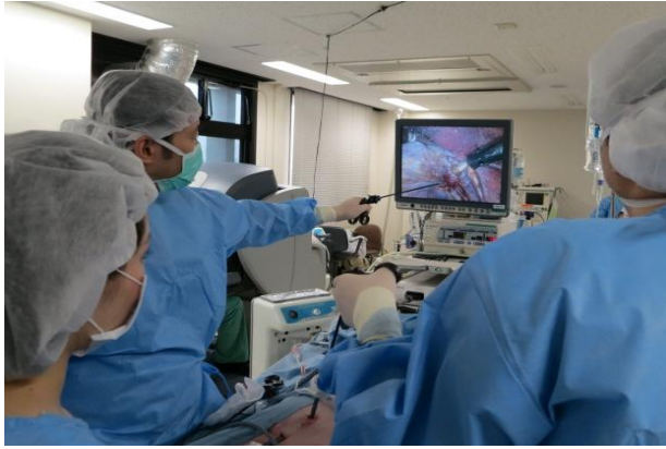
国立病院機構内視鏡手術セミナー（東京医療センタートレーニングセンター）