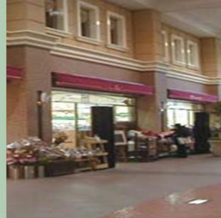
病院内に何でも揃う ショッピングモールあり！