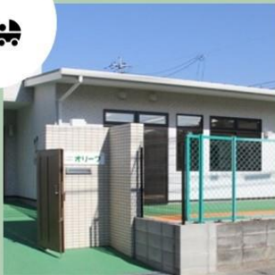
院内保育所オリーブ