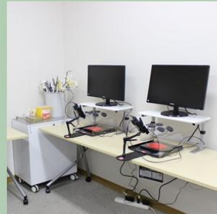
シミュレーションルームで 訓練できる！