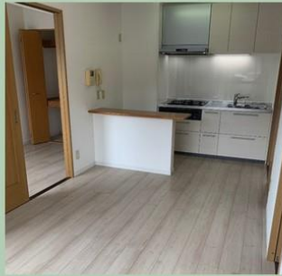
1LDK 駐車場付き！ 22,000～25,000円