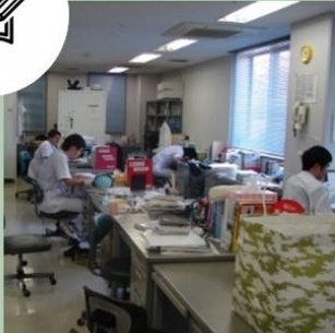
専用の部屋でゆったり