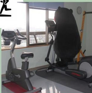
院内に職員用ジムもあり