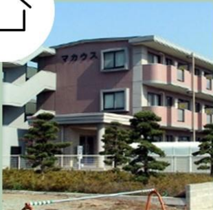
7棟130部屋、徒歩5分圏内 オートロック、エアコン完備