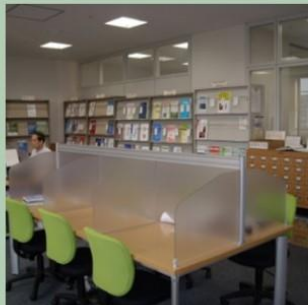
Wi-Fi環境で勉強も捗る！