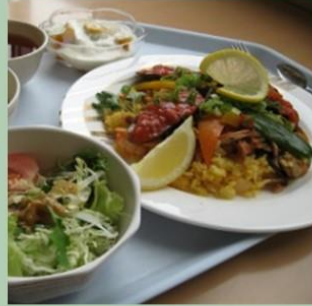
昼食は500円 朝昼晩あり！