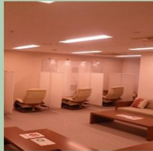
院内にリラクゼーション 施設あり