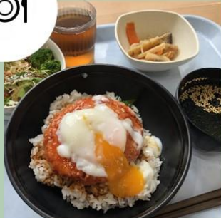
阿蘇、天草、ヘルシー 3種類から選べる