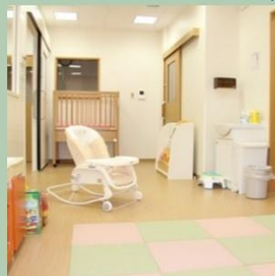
病児・病後児保育室