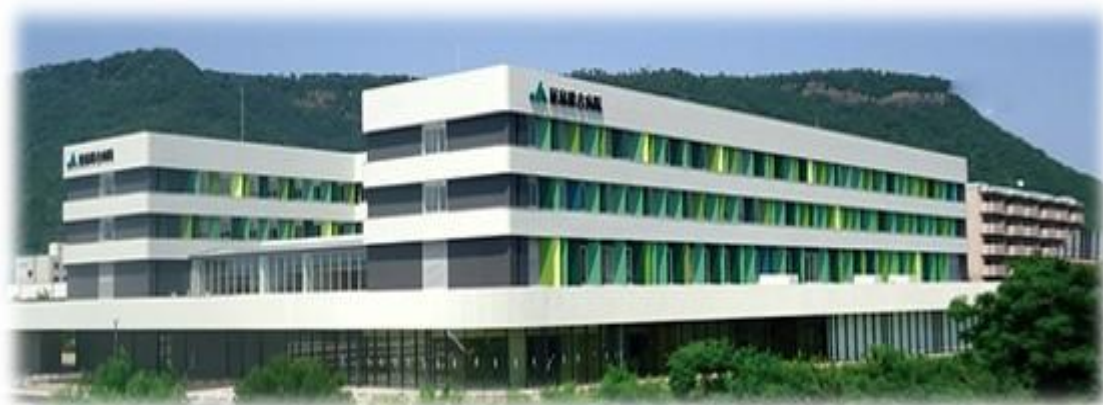
新築移転病院 2016年11月診療開始