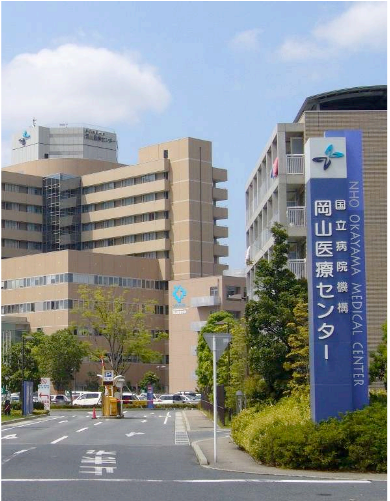
岡山医療センター外科専門研修プログラム冊子