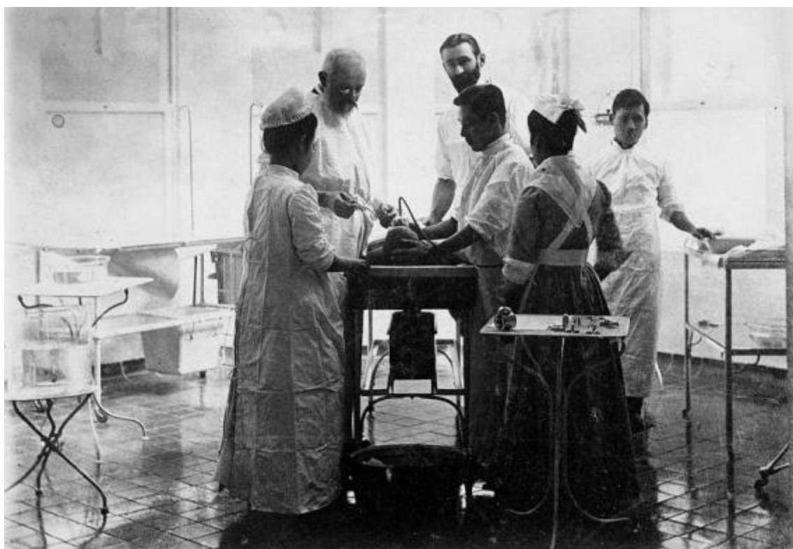
1904年（明治37年）聖路加国際病院医手術室

2018年度から開始された新外科専門制度の下では、外科サブスペシャリティ領域6科（消化器外科、心臓血管外科、呼吸器外科、小児外科、乳腺外科、内分泌外科）が加わったオール聖路加と多彩な連携施設が協力しあって、外科医を育てる専門研修プログラムを作成しました。