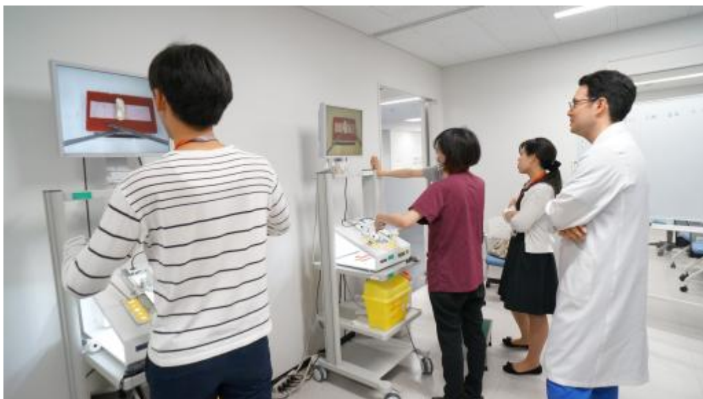
米国外科学会の Fundamentals of Laparoscopic Surgery (FLS) に基づいたトレーニング（聖路加シミュレーションセンター）