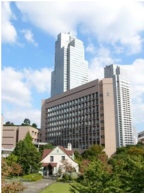
聖路加国際病院本館(520床)と、トイスラーハウス。隅田川沿いには聖路加タワーが建っています。

本プログラムの特徴は、3年間の研修のうち2年間で総合病院である基幹施設で腰をすえて標準的手術の修練に専念し、残りの期間に多彩な連携施設において専門性の高い手術の研修を補完することにあります。