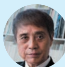
ご講演テーマ未定 安藤 忠雄 先生 (安藤忠雄建築研究所)