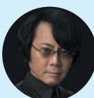
アバターと未来社会 石黒 浩 先生 (大阪大学大学院 基礎工学研究科 石黒研究室)