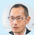
iPS細胞研究の現状と 医療応用に向けた取り組み 山中 伸弥 先生 (京都大学 iPS 細胞研究所)