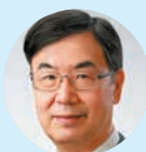
制御性T細胞と新しい免疫医療 坂口 志文 先生 (大阪大学 免疫学フロンティア研究センター)