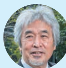
人間の本质といのちがつながる 地球の未来 山極 壽一 先生 (総合地球環境学研究所)