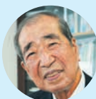
継続が想像を超える創造を生む 岸本 忠三 先生 (大阪大学 免疫学フロンティア研究センター)