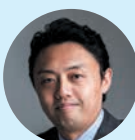
医学とAI 松尾 豊 先生 (東京大学大学院工学系研究科 人工物工学研究センター／ 技術経営戦略学専攻)